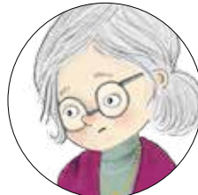
Frk. Græsk Katolsk: