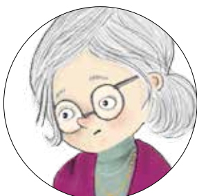
Frk. Græsk Katolsk